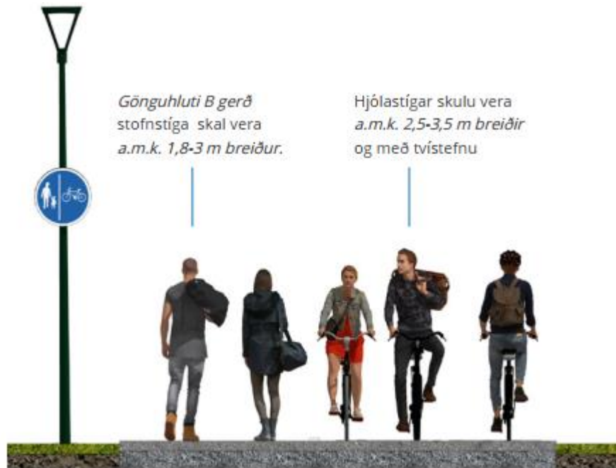
Mynd 31.15 Sníð af uppbyggingu á aðgreindum stofnstíg af B gerð.