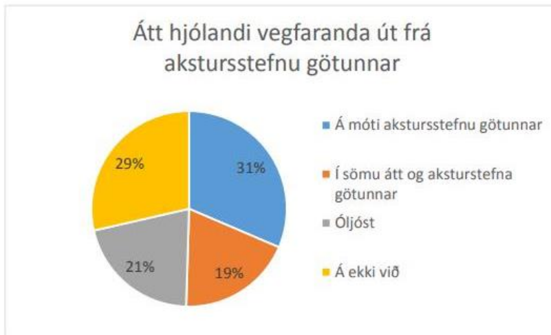
Mynd 9: Greining á átt hjólandi vegfaranda út frá akstursstefnu götunnar, þegar áreksur varð á milli reiðhjól og bifreiðar við gatnamót eða inn- og útkeyrslu á árunum 2015 og 2016.